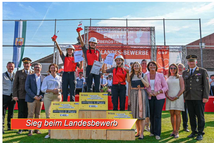
Sieg beim Landesbewerb

Für die Gruppe war dies bereits die 4. Teilnahme an einer Jugend WM. 2017 wurde sogar der Vizeweltmeistertitel errungen. Eine mögliche Wiederholung dieser Leistung war zum Greifen nah, da im Hindernislauf mit 40,39 Sekunden fehlerfrei, die zweitschnellste Zeit gelaufen wurde. Leider kamen beim Staffellauf 10 Fehlerpunkte hinzu, wodurch die gute Zeit von 72,11 Sekunden "nur" mehr zu einem 4. Platz reichte.