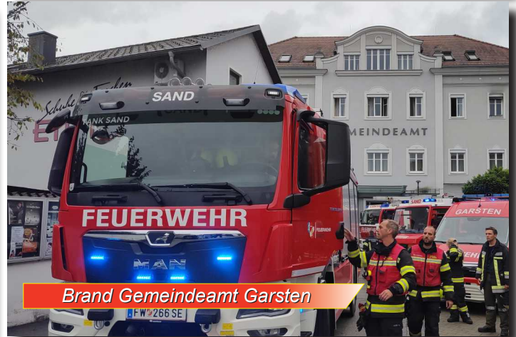
Brand Gemeindeamt Garsten