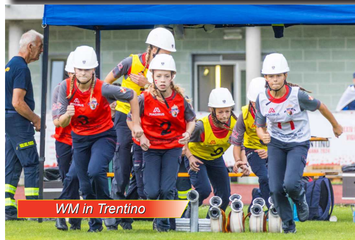
WM in Trentino