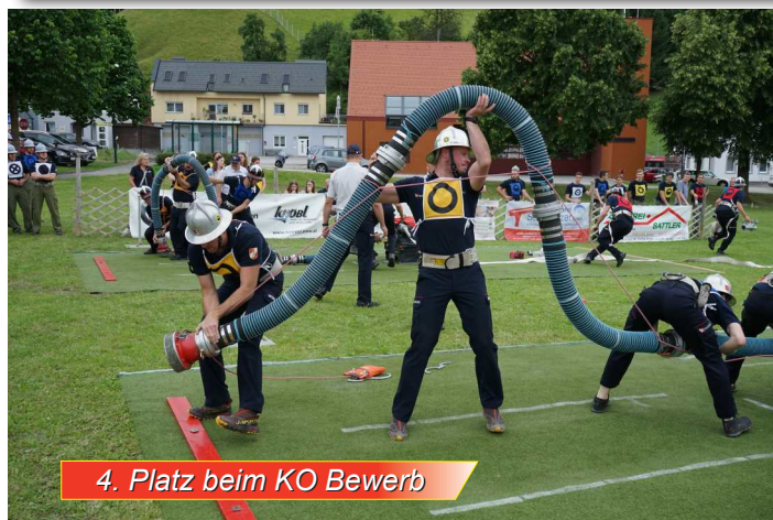
4. Platz beim KO Bewerb