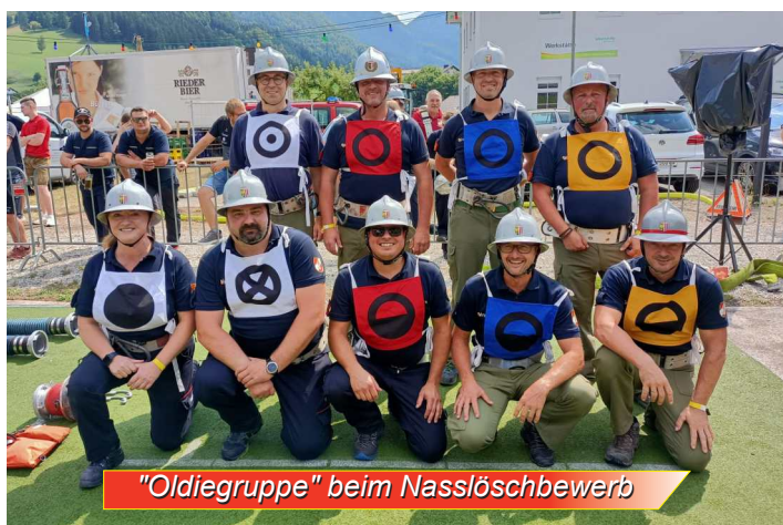
"Oldiegruppe" beim Nasslöschbewerb

Beim Ennstaler Nasslöschbewerb am 03. August 2024 nahm neben den 2 regulären Gruppen auch diesmal wieder eine rasch zusammengestellte "Oldiegruppe" teil, die sich wacker schlagen konnte.