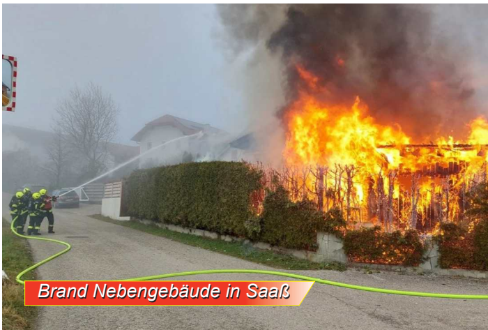
Brand Nebengebäude in Saaß