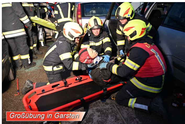
Großübung in Garsten

Im Jahr 2024 wurden von den Kameradinnen und Kameraden in 62 Ausbildungsveranstaltungen über 1.300 Übungsstunden aufgewendet.