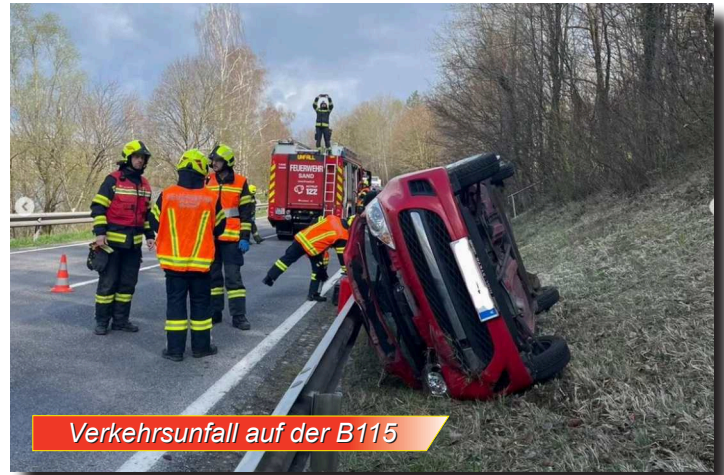
Verkehrsunfall auf der B115

Insgesamt leisteten bei 40 Einsätzen (34 technische Einsätze und 6 Brandeinsätze) 496 Feuerwehrleute über 920 Einsatzstunden .