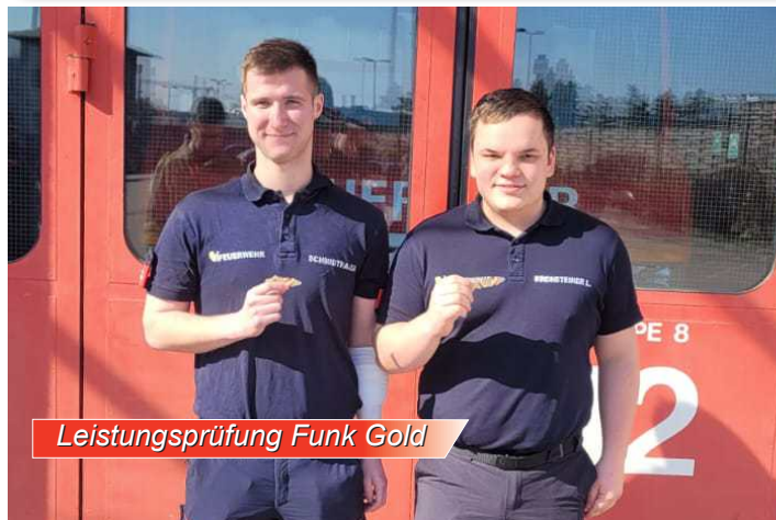
Leistungsprüfung Funk Gold