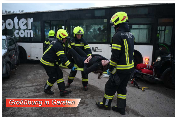
Großübung in Garsten