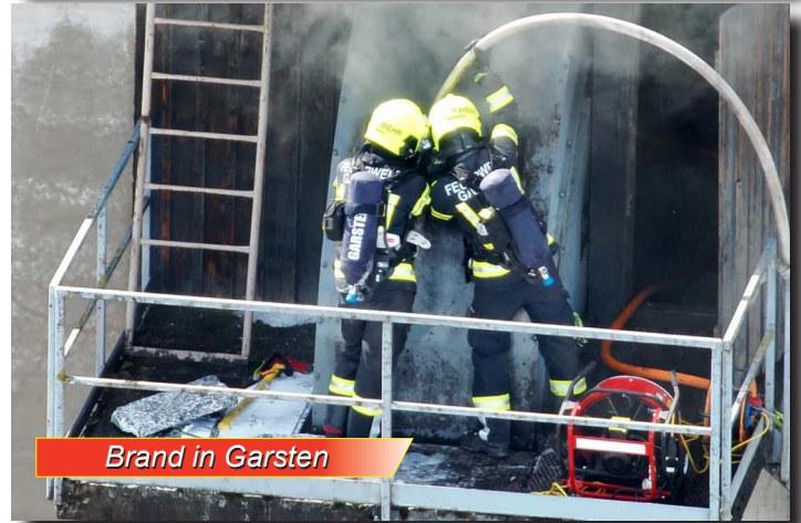
Brand in Garsten