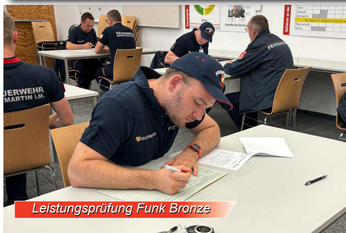
Leistungsprüfung Funk Bronze